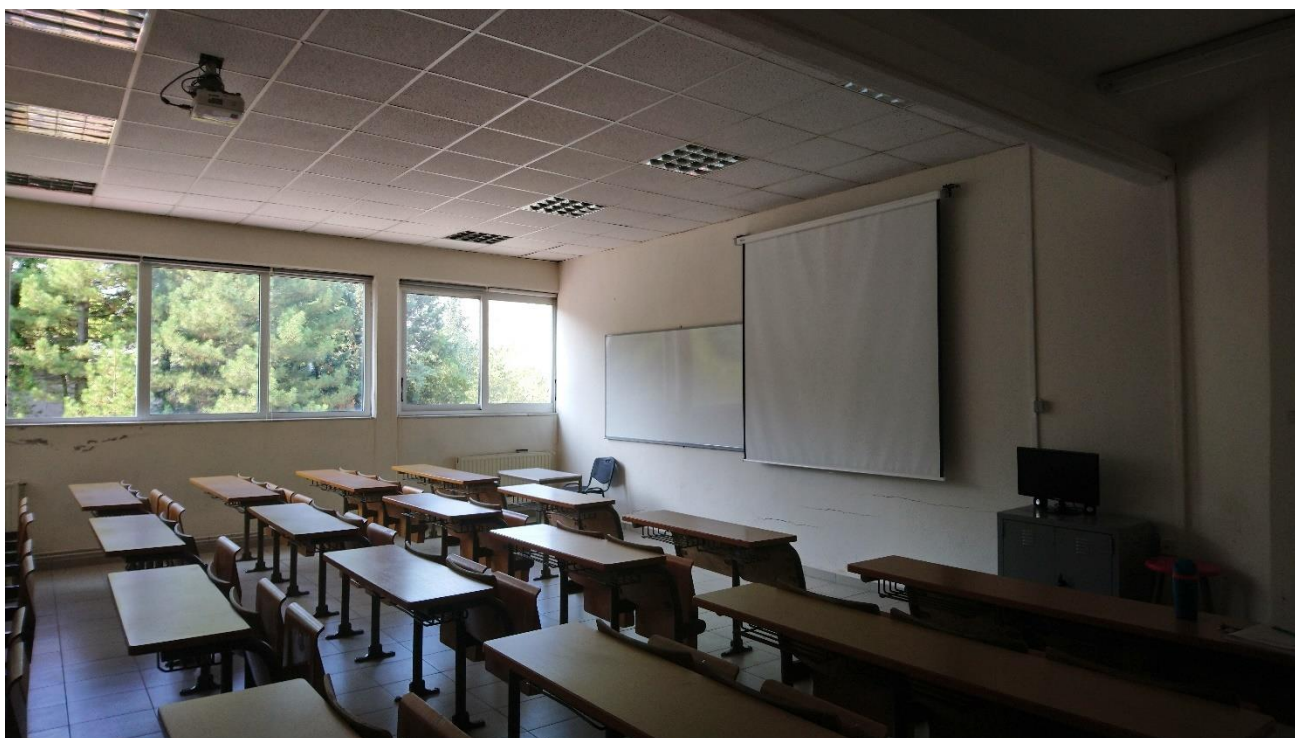
Ενδεικτική Αίθουσα Διδασκαλίας (4405)