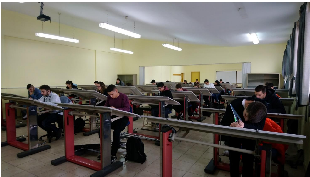
Αίθουσα Τεχνικού Σχεδίου